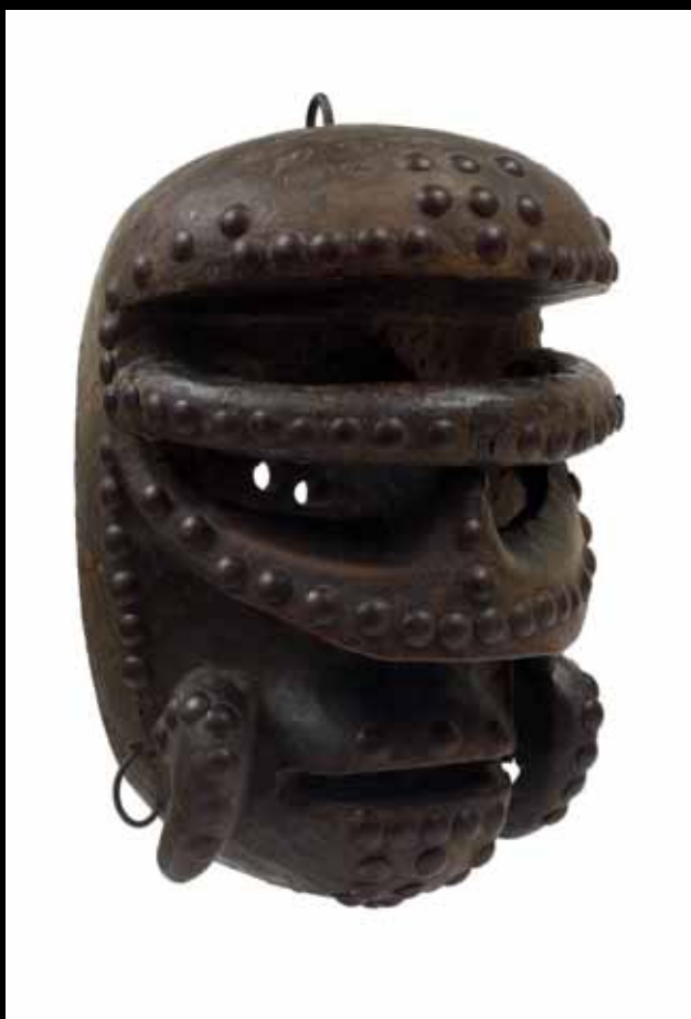
446. BÉTÉ CÔTE-D'IVOIRE Bois et métal. H. 25 cm

De son passage en Afrique de l'Ouest, reste l'ensemble de masques et statuettes ici présenté, un lien très fort avec le Cap-Vert, et les souvenirs d'une solide amitié avec Jean Rouch.