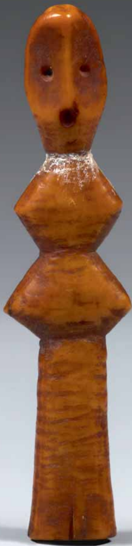
416. LEGA R.D DU CONGO Ivoire. H. 11,5 cm

Belle statuette au corps géométrique supportant une tête ovale aux traits subtilement structurés de manière minimaliste autour de trois orifices circulaires pratiqués pour figurer les yeux et la bouche. Belle patine orangée avec restes d'applications de poudre blanche utilisée lors des rituels.