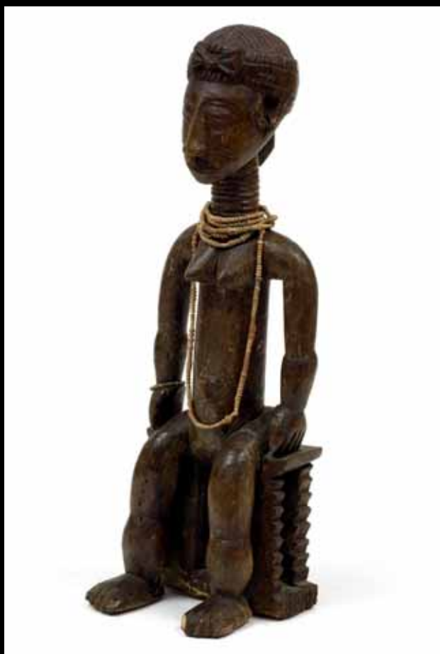
447. ATTIE CÔTE-D'IVOIRE Bois. H. 32,5 cm

Rare statuette féminine assise sur un haut tabouret les mains reposant sur l'extérieur des cuisses. Le cou est annelé, et le visage au nez busqué est surmonté d'une coiffure complexe. Patine brune, collier de petites perles. Perforation destinée à passer le pagne entre le personnage et le siège.